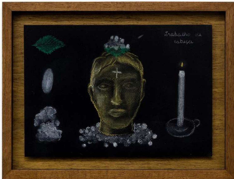
Trabalho de cabeça, 2024

Pastel seco e lápis aquarelavel sobre papel negro aquarelado 21 x 29,5 cm