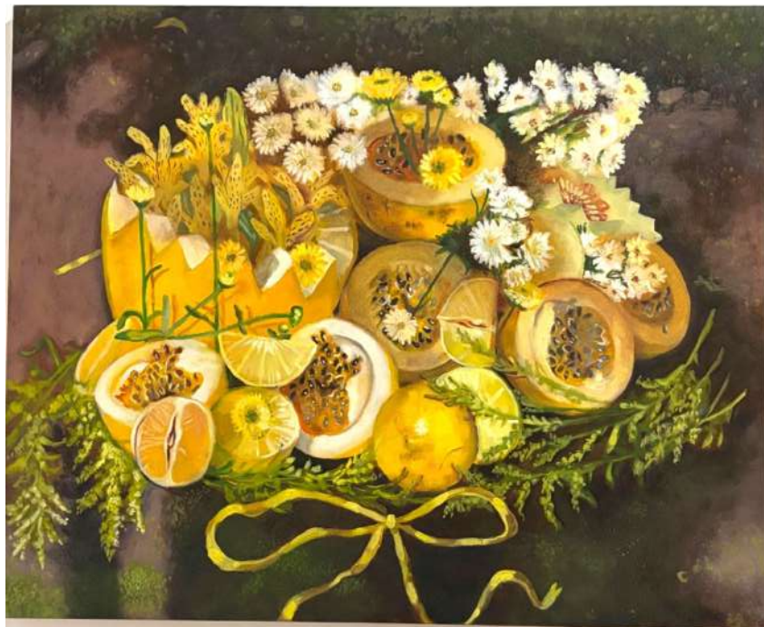
Na Beira do Rio óleo e pasta de cera sobre tela 58,5 x 72 cm 2025