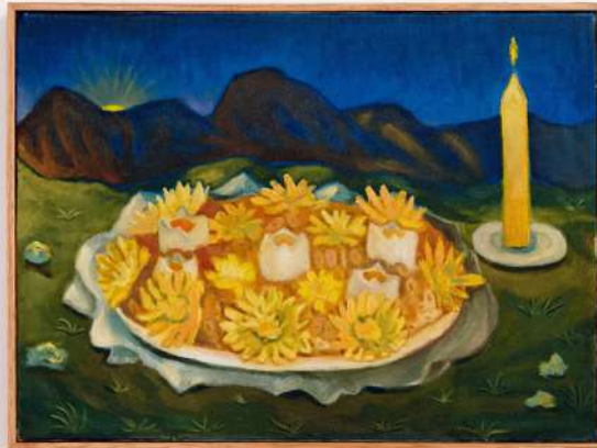
Omolocum óleo e pasta de cera sobre tela 30x40cm 2024