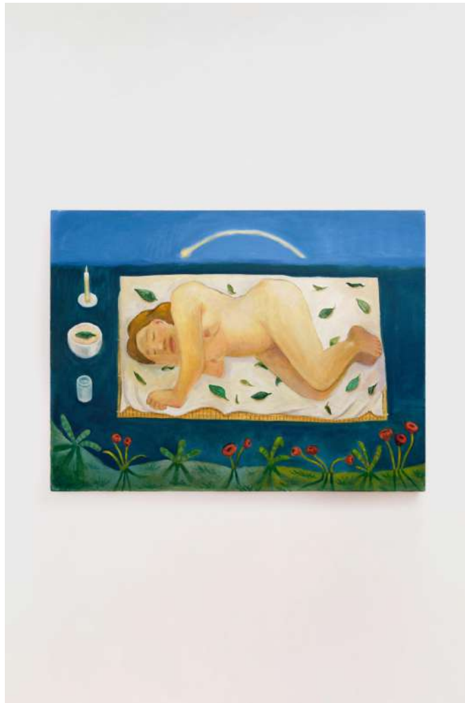
Deitada óleo sobre tela 60x80cm 2024