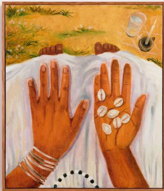
Búzios Óleo sobre tela 35 x 30 cm 2024