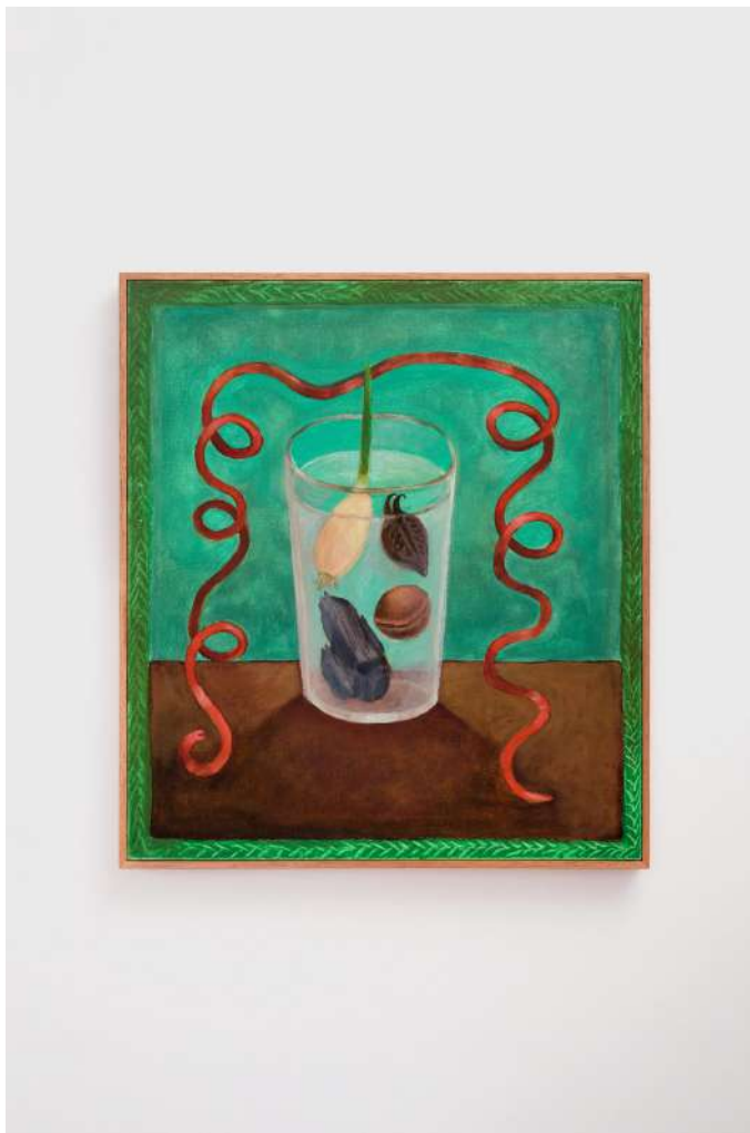
Firmeza de Carnaval Pasta de cera e óleo sobre tela 50 x 40 cm 2024