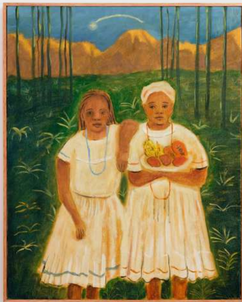
"Eu vi um clarão nas matas, Eu pensava que era dia", Óleo sobre tela 40 x 50 cm 2024