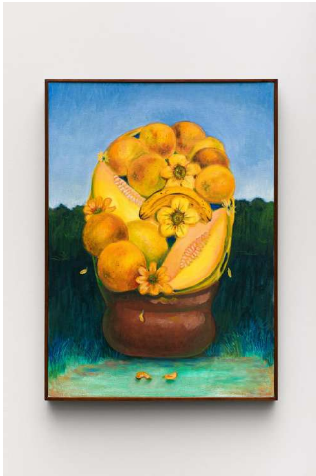
Cesta de frutas amarelas óleo e pasta de cera sobre tela 70 x 50 cm 2025