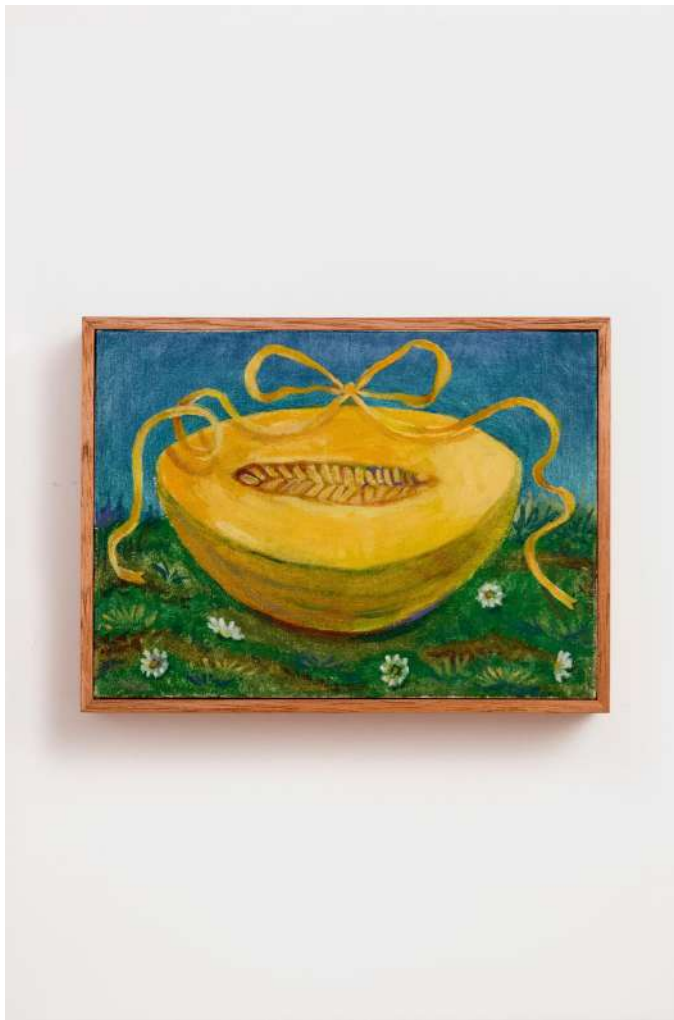
Melão para Oxum IV óleo e pasta de cera sobre tela 16x22cm 2024