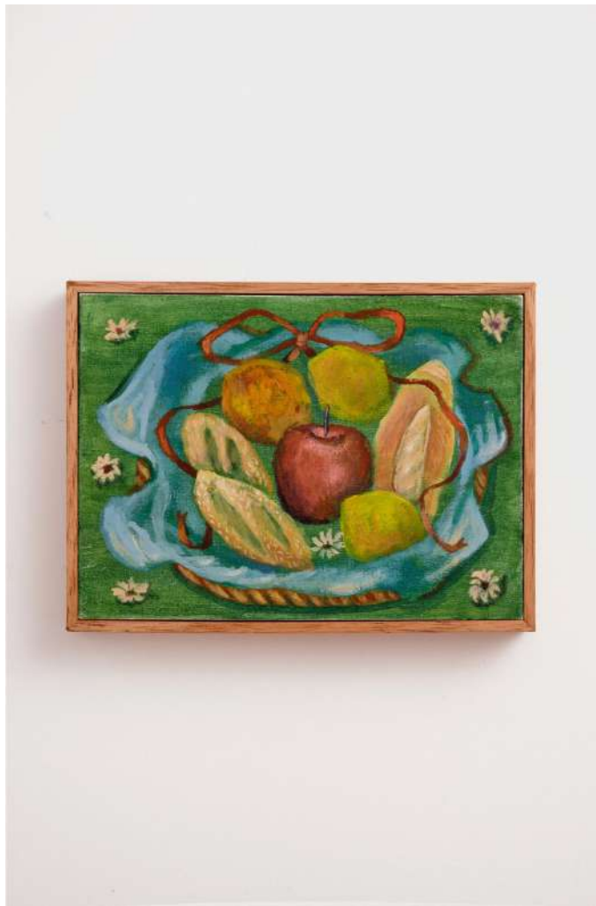
Cesta com frutas e pães óleo sobre tela 16 x 22 cm 2024