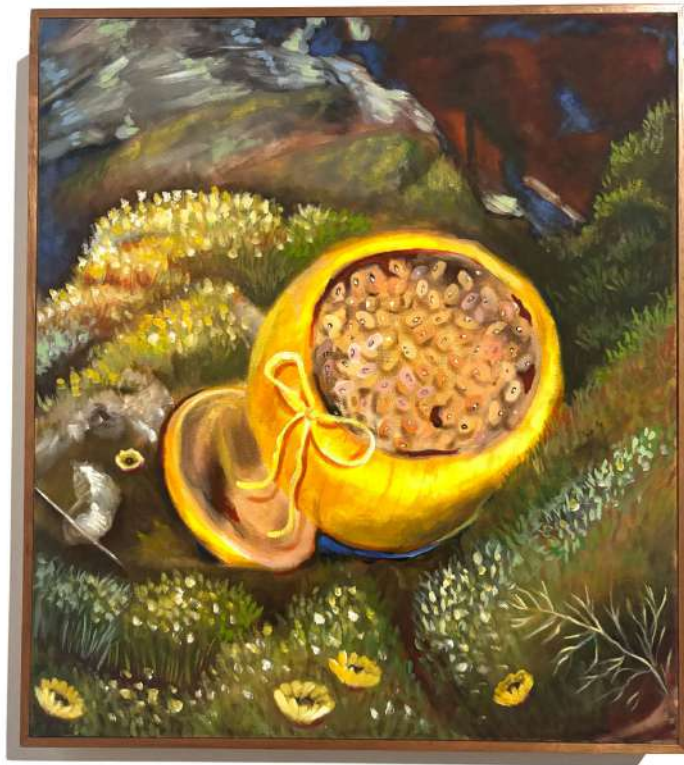
Oferenda para Oxum na Cachoeirinha óleo sobre tela 40 x 45 cm 2025