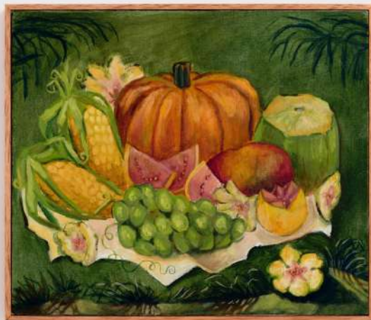
Okê Arô óleo e pasta de cera sobre tela 30 x 35cm 2024