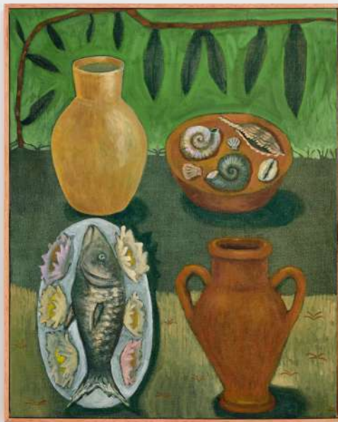
Veio do mar de Janaína óleo e pasta de cera sobre tela 50x40cm 2024