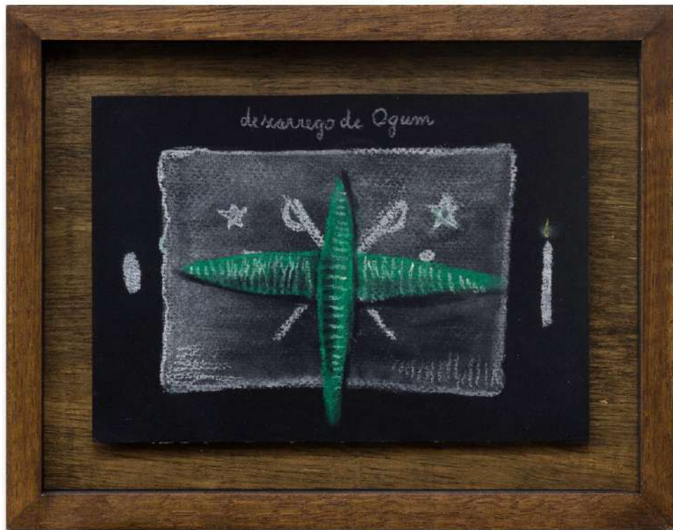
Descarrego de Ogum, 2024

Pastel seco e lápis aquarelável sobre papel negro aquarelado 14 x 21 cm