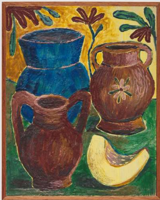
Orayêyêô encáustica sobre mdf 24 x 19 cm 2019