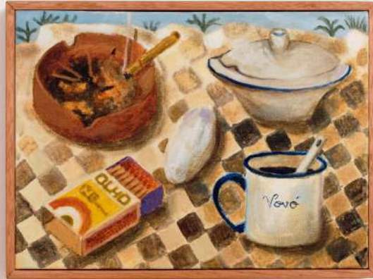
Risca Fogo óleo sobre tela 16x22cm 2024