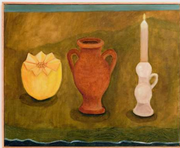
Vida, Corpo e Espírito óleo e pasta de cera sobre tela 40x50cm 2024