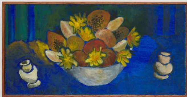
Oferecimento para Oxum óleo e pasta de cera sobre tela 20x40cm 2019