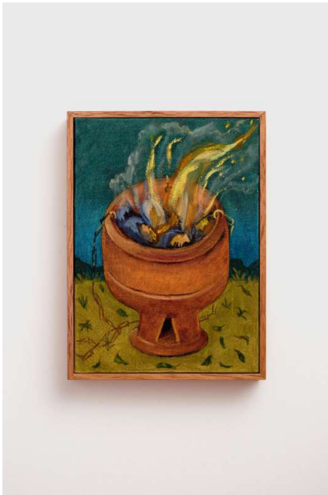
Vamos defumar filhos de fé óleo sobre tela 22 x 16 cm 2024