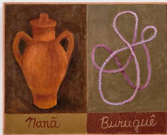
Naná Buruquê óleo e pasta de cera sobre tela 40x50cm 2024