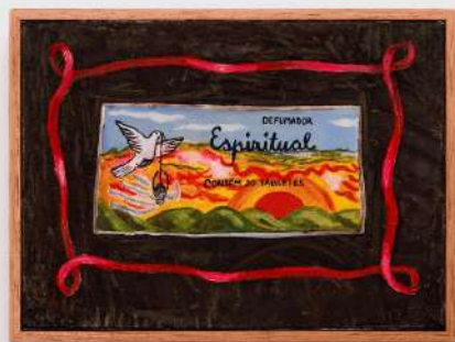
Defumador Espiritual 16 x 22 cm pasta de cera e óleo sobre tela 2024