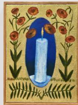
Toco de Luz