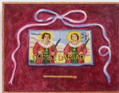
Cosme e damião 16 x 22 cm pasta de cera e óleo sobre tela 2024