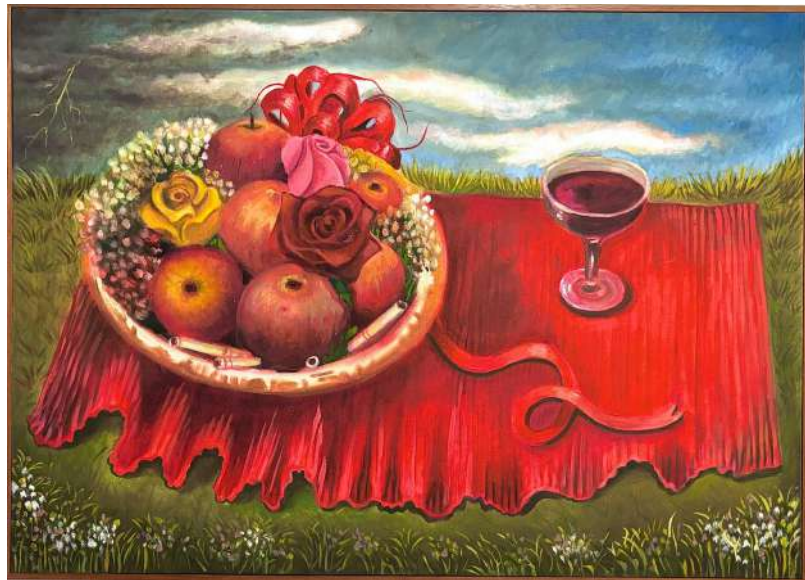
Cai chuva cai sereno óleo sobre tela 50 x 70 cm 2025