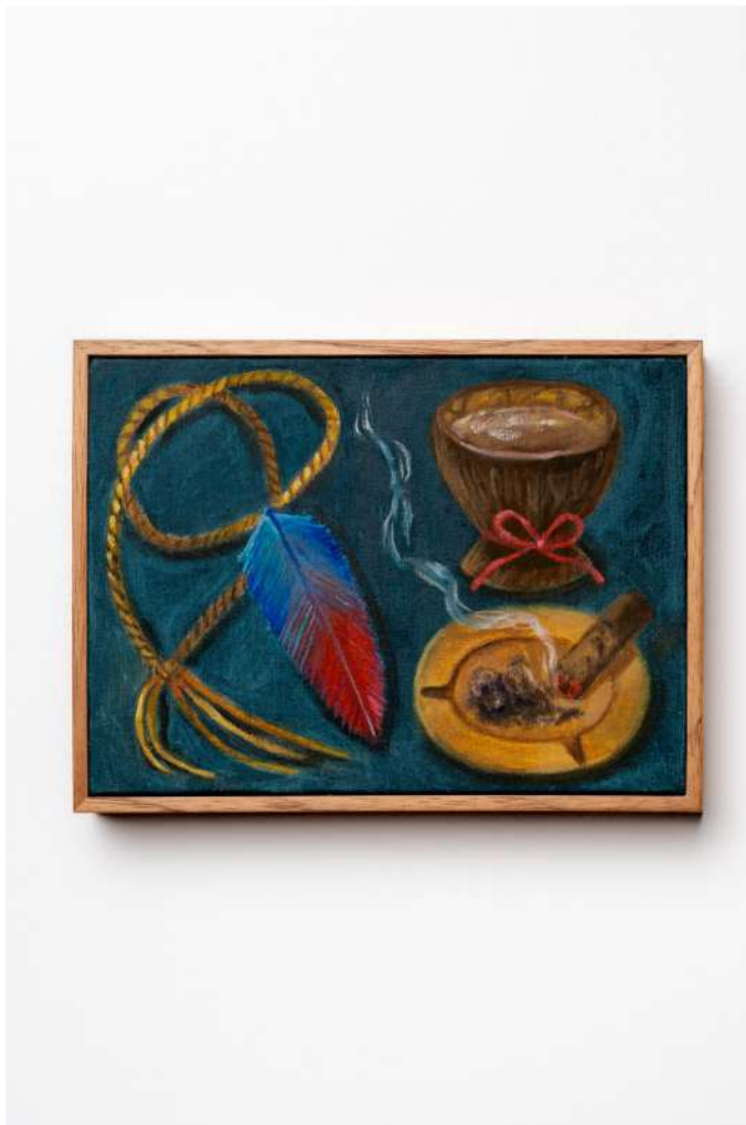
Penacho, coité e charuto óleo sobre tela 16x22cm 2024