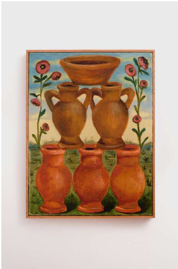
Coleção de Vasos óleo e pasta de cera sobre tela 40x30cm 2024