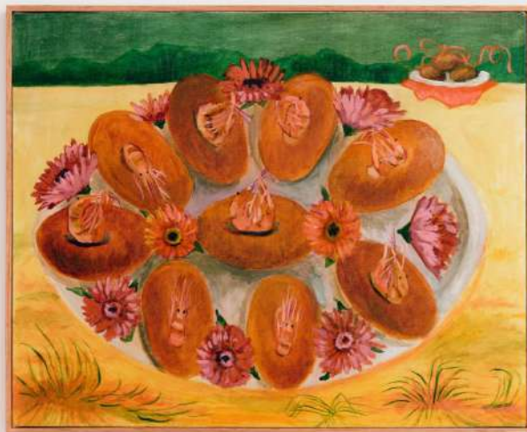
Acarajés para lansã (e para os eguns) óleo sobre tela 40x50cm 2024